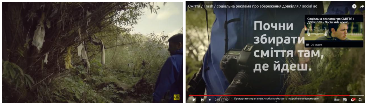
Рис. 2.2. Кадри відеоролика І. Лазоркіна «Сміття»

( https://www.youtube.com/watch?v=jW262W8IRLg ) [Ошибка! Источник ссылки не найден.]