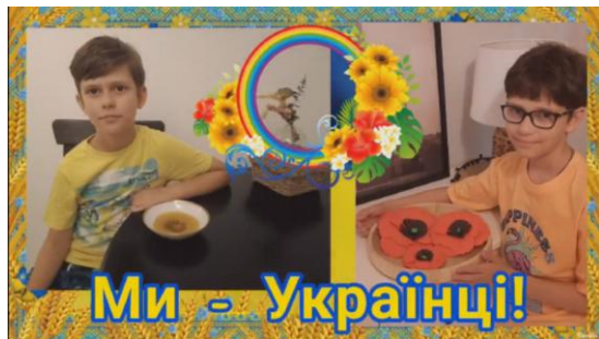
Рис. 2.7. Кадри аудіовізуального медіапродукту, розробленого учнями 4-В класу ЗЗСО №1 м. Слов'янська

У процесі підготовки до свята учні 4-В класу разом з учителем Т.О. Дьяченко обговорили концепцію вітального відео, дібрали музичний супровід, визначили кольорову палітру, підготували фотоматеріали і необхідний візуальний супровід. Також здобувачі початкової освіти дібрали епітети, які характеризують нашу країну, і вітальні слова для початку і завершення відео.