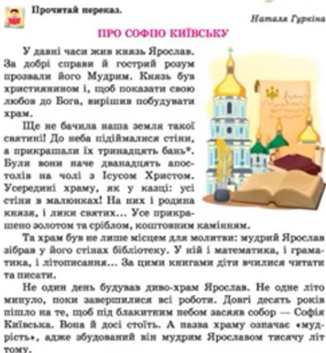
Рис. 2.3. Оповідання Н. Гуркіної «Про Софію Київську»

Здобувачі початкової освіти читають текст самостійно і визначають нову та вже відому для них інформацію.