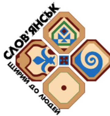
Рис. 2.4. Графічні зображення для роботи з логотипами

Завдання: «Поміркуйте, що, на вашу думку, об'єднує ці зображення, що є спільного? Чи можна стверджувати, що всі вони певним чином стосуються нашого міста?»