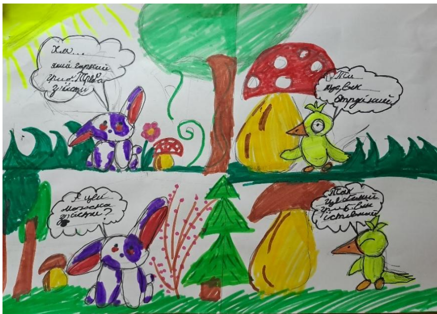
Рисунок 7. Робота учениці 1-го класу за темою «Їстівні та отруйні гриби»

Відзначимо, що виконуючи попередні – підготовчі – вправи (№№ 1–5), учні познайомились із поняттям «екологічний комікс», складовими частинами та навчились доповнювати його власним текстом та ілюстраціями. Тож на останньому етапі здобувачам початкової освіти було запропоновано самостійно створити екологічний комікс-проект «Мій екокомікс» у межах 2-х уроків. Так, на першому уроці першокласники отримали одну з двох тем за вибором: «Як доглядати за рослинами?» і «Їстівні та отруйні гриби»; та створювали комікси самостійно або в мікрогрупах (за потреби). Над створенням своїх проєктів учні працювали на папері (рис. 7).