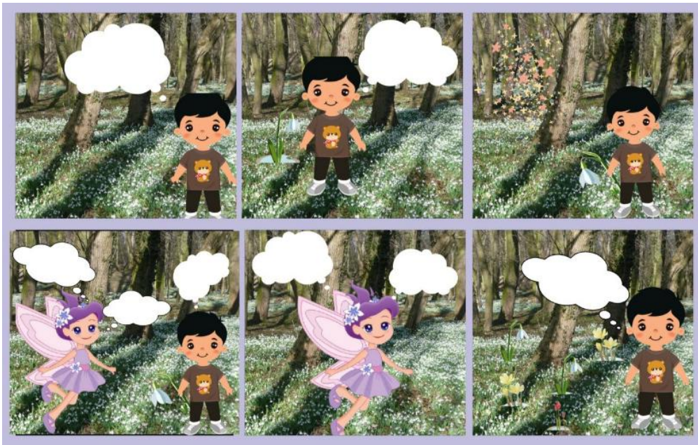
Рисунок 5. Вправа 4 «Доповнюємо комікс власним текстом»

Експериментальним навчанням було передбачено виконання вправи 4 «Доповнюємо комікс власним текстом», яка була підготовчою до наступних творчих вправ та передбачала виявлення більшої самостійності в роботі. Зокрема першокласникам було запропоновано заповнити власним вигаданим текстом «мовні хмаринки» відповідно до поданих ілюстрацій коміксу «Збережемо першоцвіти» (рис. 5).