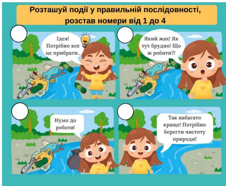
Рисунок 3. Вправа 2 «Відновлюємо порядок подій у коміксі»

Після цього кожен учень отримав подібне самостійне завдання на відновлення коміксної історії і поділився нею в створеній групі. Отже, вправа 2