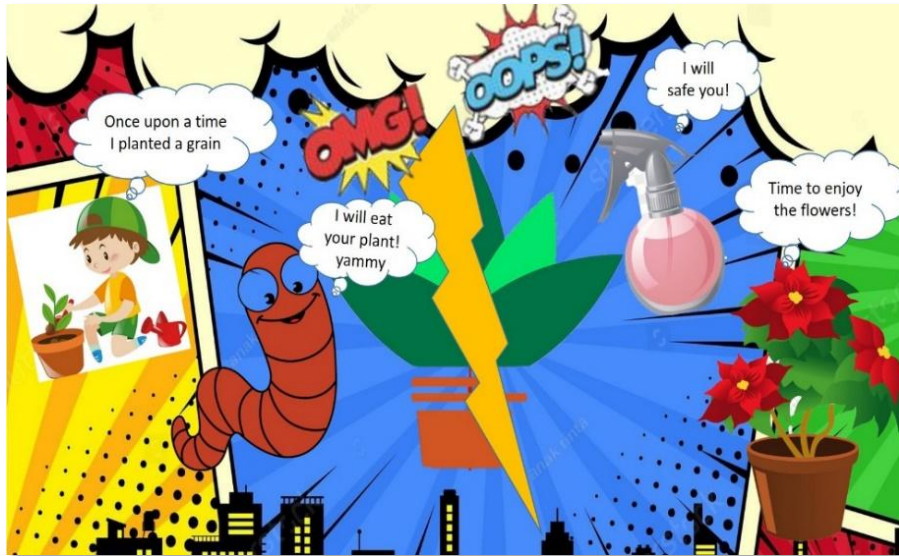
Рисунок 8. Робота учня 1-го класу за темою «Як доглядати за рослинами?»

Другий урок був присвячений презентації та обговоренню учнівських продуктів діяльності. Під час аналізу проєктів-коміксів особливу увагу учнів було звернено на відповідність змісту темі, правильність побудови, послідовність сюжету та цілісність історії.