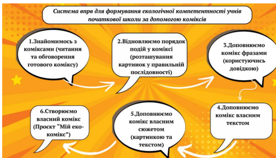
Рисунок 1. Експериментальна система вправ для формування екологічної компетентності здобувачів початкової освіти за допомогою екологічних коміксів

З метою реалізації поставленої мети було розроблено та впроваджено на уроках «Я досліджую світ» систему вправ із використанням екологічних коміксів. Експериментальна система складалася із 6-ти вправ, розташованих послідовно за рівнем складності змісту та характеру пізнавальної діяльності учнів (рис. 1). Робота над коміксами була спрямована на формування 3-х компонентів екологічної компетентності, особливо діяльнісного, бо за результатами констатувального експерименту в респондентів було виявлено найнижчі показники його розвитку.