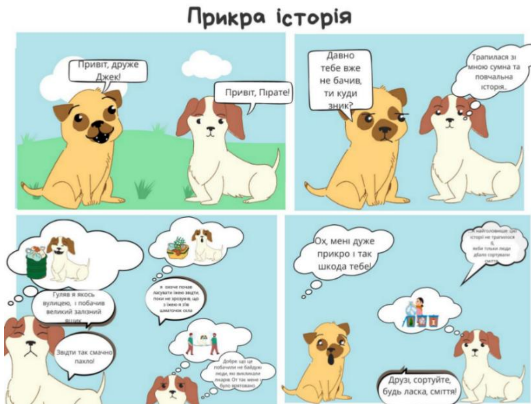
Рисунок 2. Вправа 1 «Знайомимось із коміксами»

Після цього першокласникам було запропоновано прочитати коміксну історію (рис. 2) в парах за ролями, потім – фронтально обговорити її за такими запитаннями: