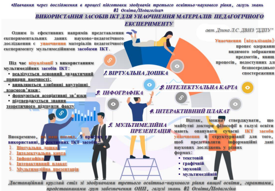
Рис. 4. Стендова доповідь «Використання засобів ІКТ для унаочнення результатів педагогічного експерименту»

уточнювальних запитань, результативність дискусії залежала від логіки і групування запитань.